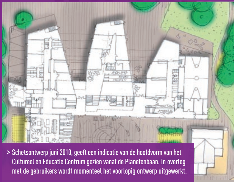
> Schetsontwerp juni 2010, geeft een indicatie van de hoofdvorm van het Cultureel en Educatief Centrum gezien vanaf de Planetenbaan. In overleg met de gebruikers wordt momenteel het voorlopig ontwerp uitgewerkt.